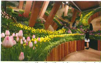
ワンダーガーデン(パレットガーデン)

そこで、開館20周年を機に常設展示場をリニューアルしようと、平成25年の6月に有識者等によるリニューアル検討委員会を立ち上げ、リニューアルの方向性などについて協議を始めた。検討委員から出された提言書を原案とし、デザインコンペを実施し、施工担当業者を乃村工芸社に決定しました。その