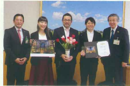
乃村工芸社のみなさん(市長に受賞を報告)

今回の受賞につながったと思われるリニューアルのポイントは、「チューリップを通年咲かせることができる独自の栽培技術」と「日本有数の曲げガラスの「砺波テクノロジー」をコラボレートさせることで1つの美しいデザインに集結させ、砺波市民が世界に誇れるコミュニケーション空間を創出できたことだと思えます。