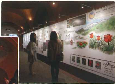
アンダーファーム(チューリップの伝来)

リニューアルにより、チューリップの魅力がたくさん詰まった「空間」となったチューリップ四季彩館常設展示をご覧ください。