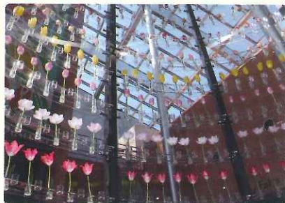
ワンダーガーデン(チューリップパレス)